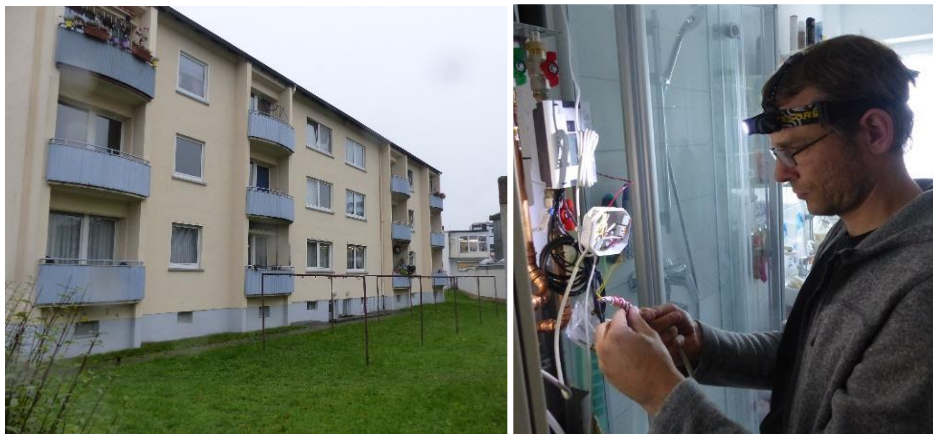
Links das untersuchte Gießener Wohngebäude aus den Nachkriegsjahren vor der Sanierung. Rechts: Ein Kollege des Passivhaus Instituts bereitet die Messungen in dem Mehrfamilienhaus vor.

Vor der Sanierung lag der Heizwärmeverbrauch im untersuchten Mehrfamilienhaus bei 119,5 Kilowattstunden pro Quadratmeter und Jahr ( \text{kWh}/(\text{m}^2\text{a}) ). Er sank bereits im ersten Jahr nach der energetischen Verbesserung des Gebäudes auf 33,3 \text{ kWh}/(\text{m}^2\text{a}) . Die Mietparteien sparten da schon durchschnittlich 72 Prozent an Heizwärme ein. Die umfangreichen Messungen des Passivhaus Instituts zeigen, dass im dritten Jahr nach der Sanierung mit 21,3 \text{ kWh}/(\text{m}^2\text{a}) sogar 82 Prozent weniger Heizwärme verbraucht wurde. Dabei lagen die winterlichen Raumlufttemperaturen mit 22,1 und 21,7 Grad Celsius vergleichsweise hoch.