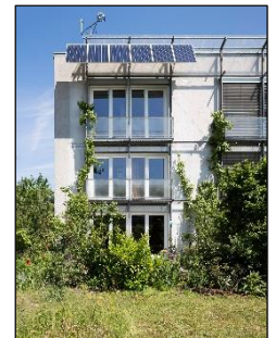
Das weltweit erste Passivhaus in Darmstadt feierte 2021 seinen 30. Geburtstag!

Vorteile der Standards Passivhaus & EnerPHit: 1. Erhöhter Komfort. 2. Im Winter ist der Heizbedarf im Gebäude gering: Die Wärme entweicht nur langsam. 3. Im Sommer ist der Kühlbedarf von Passivhäusern gering: Der gute Wärmeschutz hält die Hitze draußen. 4. Soziale Gerechtigkeit: Geringe Energiekosten bedeuten auch geringe Nebenkosten, eine Grundlage für bezahlbares Wohnen und sozialen Wohnungsbau.