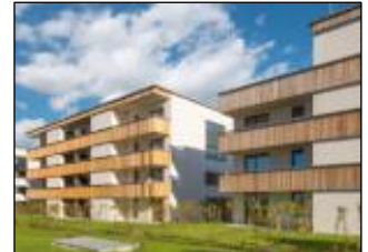
Sozial und hoch energieeffizient: Mehrfamilienhäuser im Passivhaus-Standard.

Passivhäuser: Das Passivhaus-Konzept reduziert den für Gebäude typischen Wärmeverlust durch Wände, Fenster und Dach drastisch. Mit den fünf Prinzipien - 1. gute Dämmung, 2. dreifach verglaste Fenster, 3. Lüftungsanlage mit Wärmerückgewinnung 4. Vermeidung von Wärmebrücken, 5. luftdichte Gebäudehülle - benötigt ein Passivhaus nur sehr wenig Energie zum Heizen und Kühlen. Passivhäuser können daher auf ein klassisches Heizsystem verzichten.